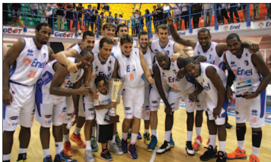
Il trionfo dell'Enel nel Memorial «Pentassuglia»

Archiviamo il terzo Memorial «Elio Pentassuglia-BMW Cup» con la consapevolezza di aver visto il bicchiere mezzo pieno. Buona la cornice di pubblico, molto di più nella prima giornata rispetto a quella conclusiva, a dimostrazione della forte curiosità degli appassionati di vedere all'opera la formazione che affronterà il secondo campionato consecutivo in serie A, terzo dell'era Bucchi. La buona affluenza di pubblico ha dimostrato in modo inequivocabile il grande affetto, mai sopito, che Brindisi ha nei confronti del compianto Elio Pentassuglia, e della grande riconoscenza per quanto Big Elio ha dato alla pallacanestro brindisina e pugliese. La terza edizione del memorial è stata anche l'occasione per presentare ufficialmente la squadra e tutto lo staff tecnico. Meno sfarzo del passato, anche se resta memorabile la presentazione nel piazzale Lenio Flacco della prima era della gestione Ferrarese. Serve poco apparire, meglio essere, e per questo condividiamo pienamente la scelta fatta.